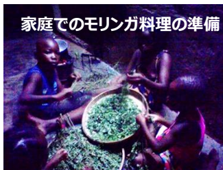
家庭でのモリンガ料理の準備

企画から4年越し。念願の食べられる緑化プロジェクトがスタートします。栄養価が高く栄養改善植物として注目されているモリンガを800本、そしてパパイヤ、マンゴ400本、計1200本を民家の敷地に植えるため、まずは農村地区で育苗をスタートします。