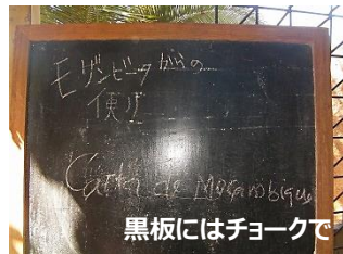
黒板にはチョークで