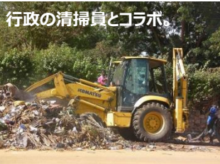
行政の清掃員とコラボ