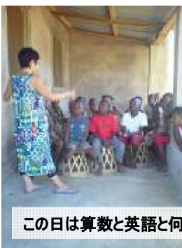
この日は算数と英語と何でも質問コーナー