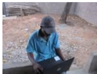
パソコン教室は個人レッスンを 続けてやっています。青年美化 活動スタッフも参加!