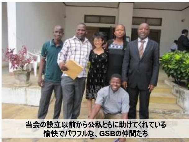
当会の設立以前から公私ともに助けてくれる 愉快でパワフルな、GSBの仲間たち

2014年の2月に申請した日本大使館のGGPに採択され、この1年、細かい書類提出に追われつづけ、やっと調印式！現地人のNGO・GSBを頭に、クイサンガ地区の20の村に井戸とトイレを設置します。総費用1千万、但し人件費ゼロ。。。現地で汗を流す人たちが一番たいへんです。調印式ではマクワ族の伝統ダンス・TOFUも披露しました。