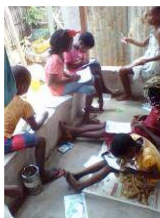
賢い子を先生役に読み書き指導