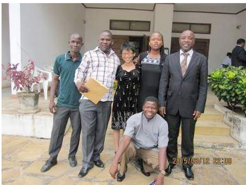
GSBのメンバーと共に出席。